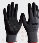
STRUMENTI PER LA SICUREZZA