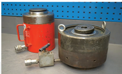
HYDRAULIC BOLT TORQUING

L'azienda è equipaggiata di tutte le attrezzature e la documentazione necessaria a svolgere le seguenti tecniche: